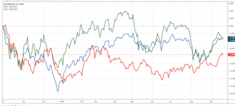
Biểu đồ tương quan biến động VN30 đối với Thị trường phát triển và Thị trường mới nổi 23/09/2019

Published on TradingView.com, September 23, 2019 00:04:33 UTC WINE:3007494,SI:305,SB:15,72(10,49)00310,88,14302,77,6314,55,6315,38